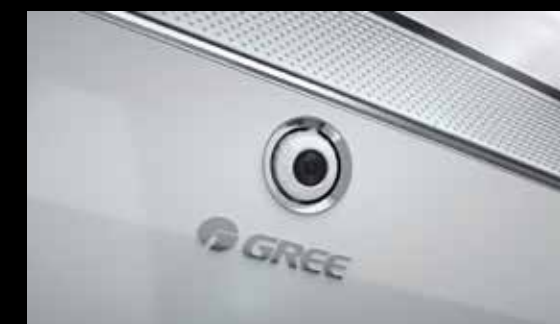
Avoid: unikanie bezpośredniego nawiewu powietrza na ludzi.

Klimatyzator Soyal jako pierwszy i jedyny w ofercie Gree został wyposażony w detektor obecności ludzi . Dzięki temu może w automatyczny sposób kontrolować zarówno obecność, jak i lokalizację osób w pomieszczeniu. Soyal wykorzystuje zdobyte informacje do realizacji automatycznej regulacji nawiewu powietrza . Zgodnie z oczekiwaniami użytkownika może on m.in. kierować powietrze bezpośrednio na ludzi lub unikać jego dystrybucji na domowników. Aby jeszcze precyzyjniej dostosować swoją pracę i zapewnić najwyższy komfort klimatyzator kontroluje także temperaturę ciała ludzi oraz temperaturę otoczenia .