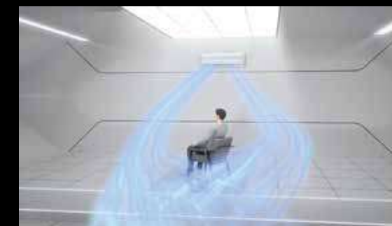
Surround: zapewnienie dopływu powietrza wokół osób znajdujących się w pomieszczeniu.