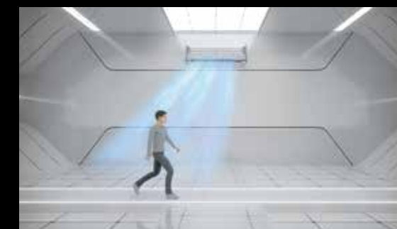
Follow: nadmuchiwanie powietrza w kierunku osób w pomieszczeniu.

Dzięki wykorzystaniu w modelu Soyal podwójnej dzielonej żaluzji poziomej, klimatyzator ten jako jedyny w ofercie Gree może jednocześnie nawiewać powietrze w dwóch różnych kierunkach . Pozwala to m.in. objąć nawiewem całe pomieszczenie, jednocześnie unikając kierowania strumienia powietrza bezpośrednio na użytkownika.